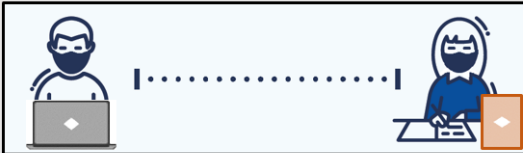
Face to Face Learning